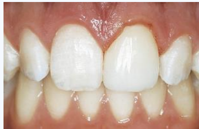
Wiederherstellung des abgebrochen Schneidezahnes mit einer CEREC-Teilkrone