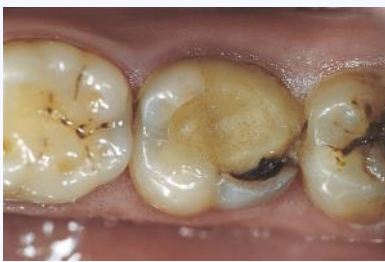
Kunststoff-Füllung mit Karies