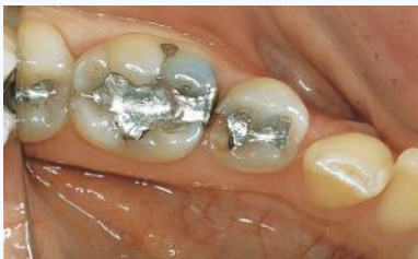
Defekte Füllung aus Amalgam