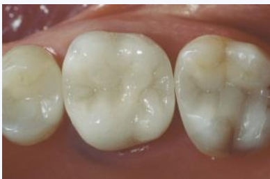
Nahezu unsichtbare CEREC-Inlays