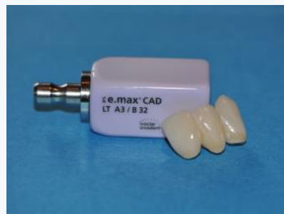
Vollkeramik-Brücke mit dem CEREC-Verfahren in einer einzigen Sitzung hergestellt und eingesetzt. Im konventionelle Verfahren braucht der Patient dazu ein Provisorium und vier Termine.