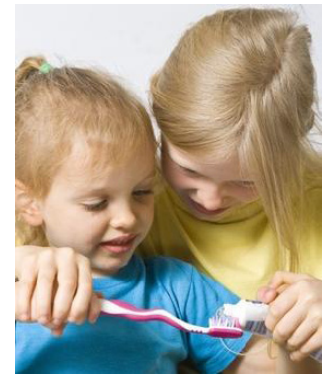
Früh übt sich: Richtige Mundpflege schon ab dem ersten Zahn. Wir zeigen Ihren Kindern, wie es geht.

Liebe Eltern! Bereits die ersten Lebensjahre sind entscheidend für ein gesundes Gebiss. Wenn hier die Weichen richtig gestellt werden, können Ihre Kinder ein Leben lang gesunde Zähne behalten und schmerzliche Erfahrungen mit dem „Zahnarztbohrer“ vermeiden. Lesen Sie hier, warum gesunde Zähne so wichtig für die positive Entwicklung Ihrer Kinder sind und mit welchen Maßnahmen wir dieses Ziel gemeinsam erreichen. Ihre Kinder werden Ihnen einmal danken, dass Sie so um ihre Zahngesundheit besorgt waren.