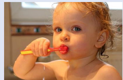
Kinder zum regelmäßigen Zähneputzen zu erziehen, ist nicht immer einfach. Deshalb unterstützen wir Sie dabei. Wie? Das erfahren Sie auf der nächsten Seite!

Lassen Sie es nicht zu lange an Flaschen mit Fruchtsäften nuckeln und verdünnen Sie diese mit Wasser. Gewöhnen Sie Ihr Kind von vornherein an regelmäßige und gründliche Zahnpflege.