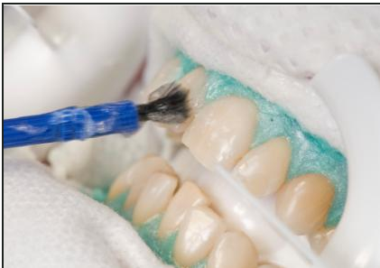
Nachdem das Zahnfleisch mit einem Schutz abgedeckt wurde, kommt das Bleaching-Gel auf die Zähne

Wie beim Home-Bleaching müssen die Zähne zuerst untersucht werden: Wenn sie Löcher, Risse oder undichte Füllungen haben, kann es beim Bleaching Probleme geben. Dann werden die Zähne gründlich gereinigt. Nur so kann das Bleaching-Gel richtig wirken. Bevor das eigentliche Bleaching beginnt, muss das Zahnfleisch mit einem speziellen Schutz abgedeckt werden.