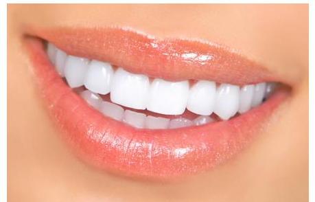
Power-Bleaching: Sichtbar hellere Zähne nach einer Stunde

Was kann man tun, wenn nur ein einzelner Zahn dunkel ist? Auf der nächsten Seite finden Sie Informationen zur Einzelzahn-Aufhellung!